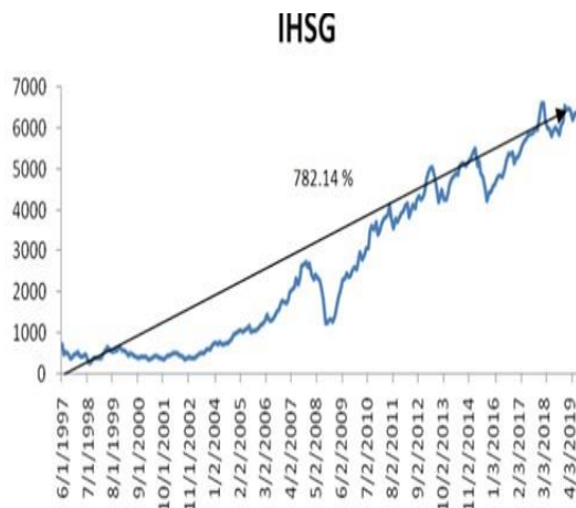
Gambar 1. Perkembangan IHSG

menanamkan modalnya, sehingga Bursa Efek menjadi incaran para investor saat ini. Tidak hanya melihat dari keuntungan saja, para investor pun melihat dari sisi lain yaitu : perkembangan IHSG yang cenderung naik dari tahun ketahun, perkembangan finansial data perusahaan itu sendiri, maupun rasionya.